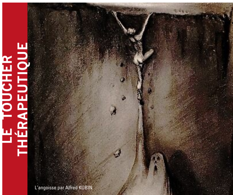
L'angoisse par Alfred KUBIN